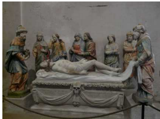
Enclos de Lampoul-Guimiliau, Frankrijk